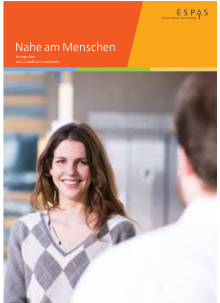
Broschüre «Nahe am Menschen» Für Menschen mit Beeinträchtigungen, die wir auf ihrem Weg in den Arbeitsmarkt begleiten und befähigen.