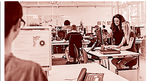
Eine IT-Schulung bei der «Espas».